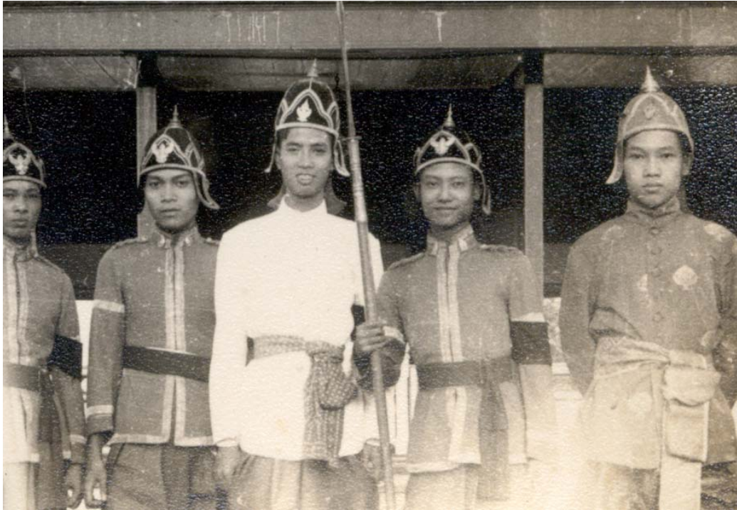
รูปที่ 6.7 กับเพื่อนจุฬาด้วยกันอีก 4 คน