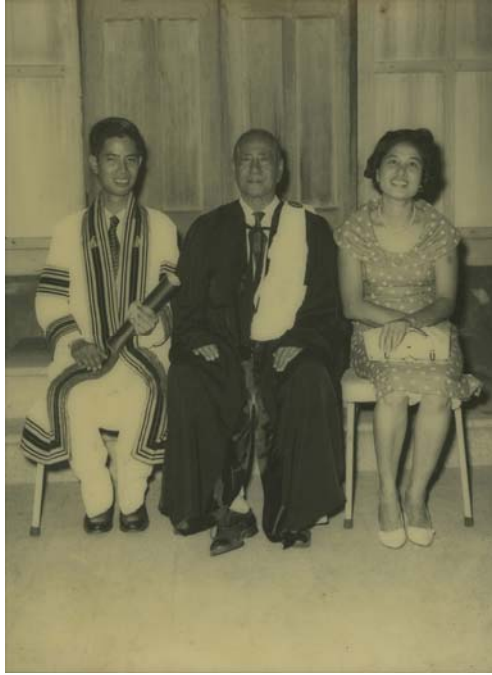
รูปที่ 6.10 ไปรับพระราชทานปริญญาจากจุฬา กลับมาถึงบ้านท่านเจ้าคุณพ่อใส่ชุดครุยของท่านถ่ายรูปร่วมกับคุณแม่และผม