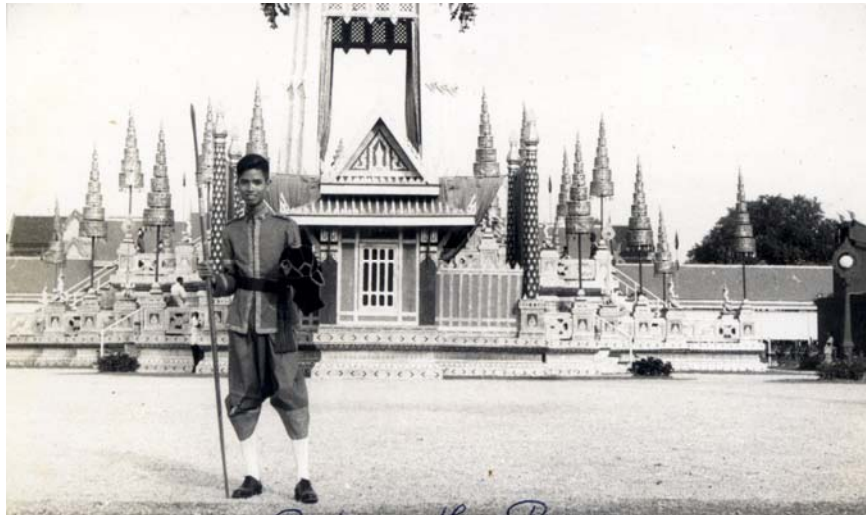
รูปที่ 6.6 ถ่ายรูปให้เห็นพระเมรุมาศชัดเจน