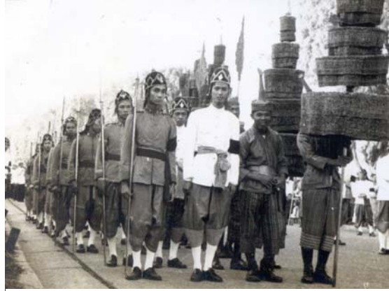
รูปที่ 6.4 อยู่แถวหน้า

พออีกวันหนึ่ง ก็สลับกันแต่งเครื่องแบบอีกแบบหนึ่ง ถ่ายภาพไว้เป็นที่ระลึกมากมาย นับได้ว่าเป็นโอกาสที่ไม่ได้เกิดขึ้นบ่อยครั้งนัก ถ่ายไว้ทั้งเป็นรูปเดี่ยวและรูปหมู่ ในรูปที่ 6.4 เป็นรูปหมู่ที่ผมยืนอยู่หัวแถว รูปที่ 6.5 เป็นรูปเดี่ยวโดยที่รูปขวามีเด็กแอบดูอยู่ด้วย รูปที่ 6.6 ก็เป็นรูปเดี่ยวให้เห็นพระเมรุมาศ