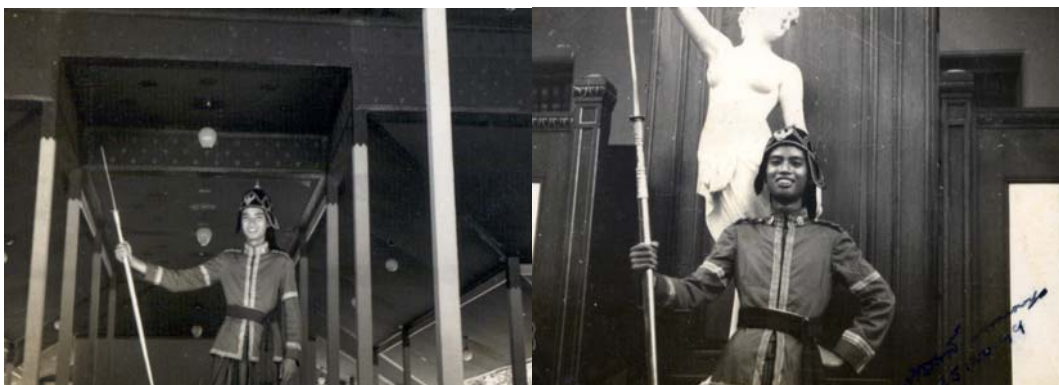
รูปที่ 6.8 ถือหอกไม่ได้ควงกลอกกลับแต่ไปทำท่าเก้ไก้ถ่ายรูป

รูปที่ 6.8 นั้นด้านซ้ายถ่ายที่บนพระเมรุมาศ ส่วนด้านขวาถ่ายในพระบรมมหาราชวัง ในมุมหนึ่งที่มีตุ๊กตาโรมันตั้งอยู่ แต่เพื่อนที่ช่วยถ่ายให้ไม่ได้สังเกตให้ดีเลยถ่ายมาโดยตัดหัวตุ๊กตาออกไปหน่อยหนึ่ง