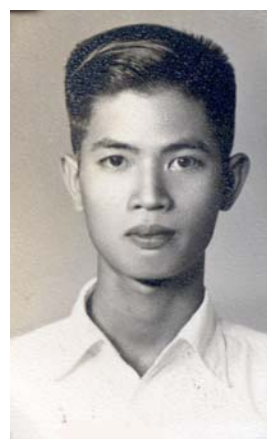
รูปที่ 6.1 นิสิตวิศวะ

ฝ่ายคุณแม่ก็บอกว่าเป็นหมอดีกว่า เป็นทนายก็อาจจะไปช่วยคนผิดให้พ้นผิด เป็นผู้พิพากษาก็อาจจะต้องตัดสินประหารชีวิตจำเลย เป็นหมอมีแต่ช่วยคน ไม่ว่าจะคนผิดหรือคนถูกเวลามาหาหมอก็กลายเป็นคนไข้ หมอก็ช่วยให้หายรักษา ถ้าเป็นทนายหรือผู้พิพากษาก็มีทั้งคนรักและคนเกลียด แต่เป็นหมอมีแต่คนรักและนับถือ ฟังดูก็เกือบจะเชื่อคุณแม่ แต่ถ้าเชื่อคุณแม่ก็จะทำให้