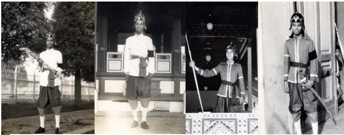
รูปที่ 6.5 ถ่ายรูปเดี่ยวไว้เป็นที่ระลึก