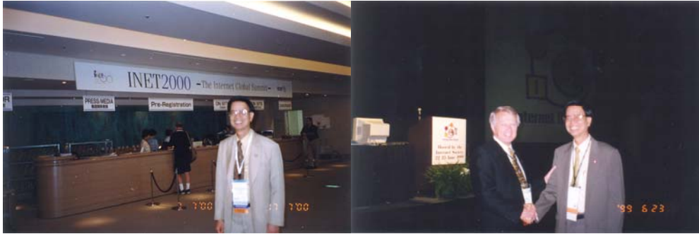
รูปที่ 28.1 ไปประชุมอินเทอร์เน็ต