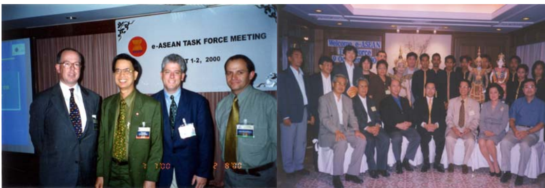
รูปที่ 28.8 ประชุมอีอาเซียนที่ประเทศไทย

ผมเป็นสมาชิกอีอาเซียน อยู่ 2 ปี จนครบวาระ แล้วในที่สุดทางอาเซียนก็ยุบอีอาเซียนไป