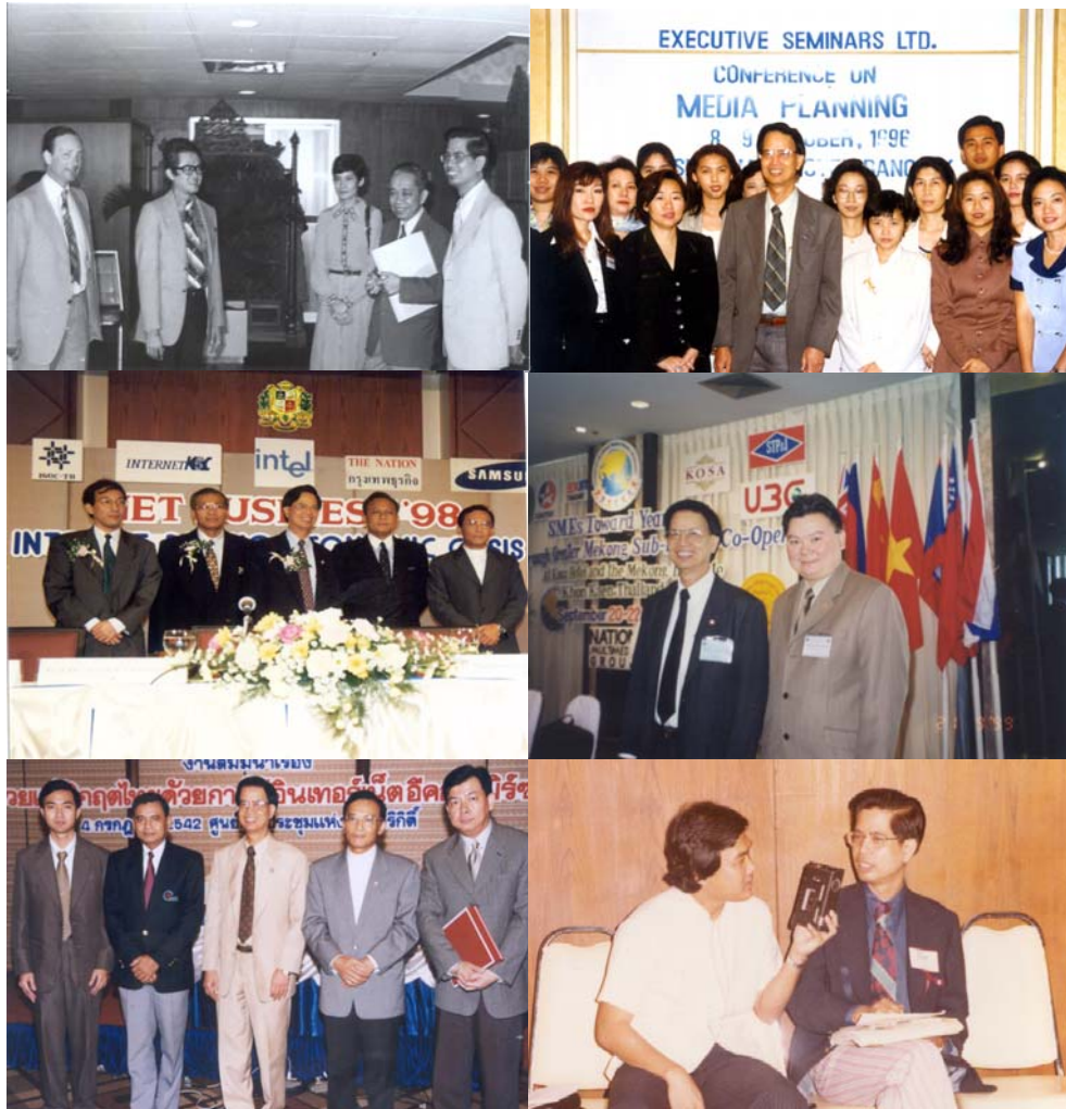
รูปที่ 33.1 บรรยายและให้สัมภาษณ์ในประเทศ