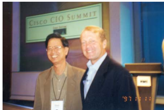
รูปที่ 33.9 ศ.ศรีศักดิ์ กับ จอห์น แชมเบอร์ส ซีอีโอ บริษัทสหรัฐอเมริกา