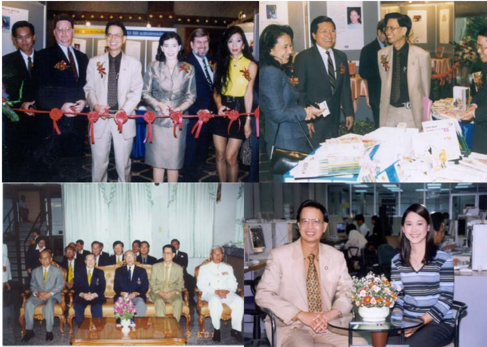
รูปที่ 33.3 อีกชุดหนึ่งของตัวอย่างการบรรยายและให้สัมภาษณ์ในประเทศ